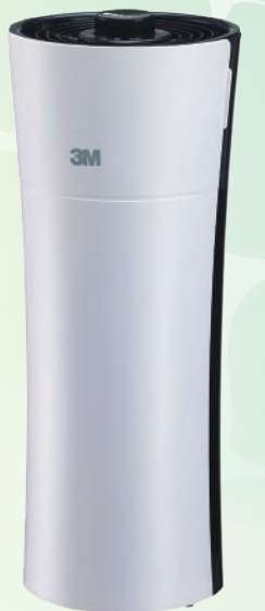
▲3M淨呼吸空氣清淨機 淨巧型 FA-X50T