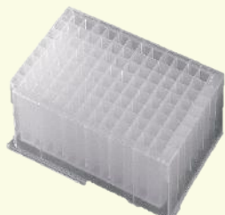
P-1ML-SQ-C P-2ML-SQ-C 25 Plates Per Case