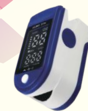
▲指夾式脈博血氧儀

購買6支Axyjet Pro 即送GARMIN指針智慧腕錶或2支以上75折優惠!