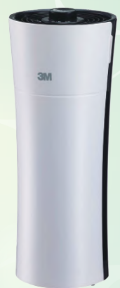
▲3M淨呼吸空氣清淨機 淨巧型 FA-X50T