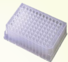
P-DW-11-C P-DW-20-C 5 Plates Per Bag, 10 Bags Per Case